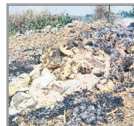
रेवाड़ी। धारुहेड़ा के औद्योगिक क्षेत्र में जला हुआ कचरा तथा शहर के नेहरू पार्क के पास जलता हुआ कचरा।