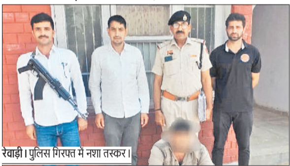
रेवाड़ी। पुलिस गिरफ्त में नशा तस्करो।