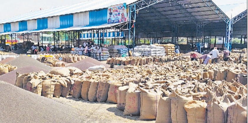
रेवाड़ी। रेवाड़ी अनाजमंडी में फंड पर लगी सरसों की देखिया।