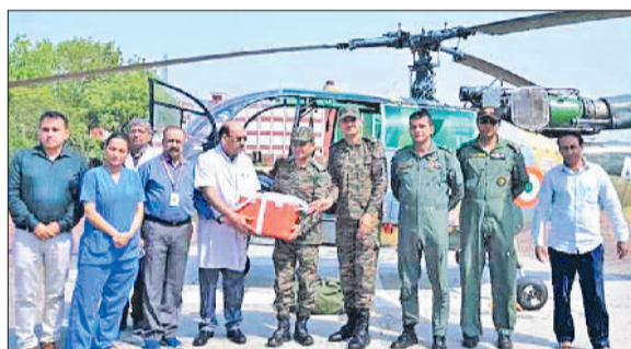
रेवाड़ी। रोहतक पीजीआई से ऑर्गन एयरलिफ्ट करने का फाइल फोटो।

मौत अटल है, लेकिन हम तय कर सकते हैं कि हमारी मौत भी किसी के जीवन का कारण बने