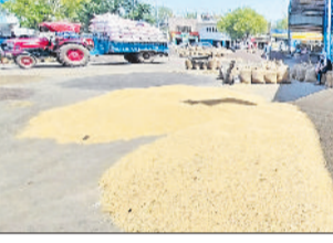
रेवाड़ी। कोसली मंडी से गेहूं का उठान करते हुए मजदूर।

जिले की अनाजमंडियों में पिछले एक सप्ताह से सरसों व गेहूं की आवक धीमी पड़ गई है। सरसों की सरकारी खरीद को बंद होने में भी तीन दिन शेष है। सरसों की एमएसपी पर खरीद एक मई और गेहूं की सरकारी खरीद 15 मई तक की जाएगी। 28 मार्च से शुरू हुई सरकारी खरीद में अब तक हैफेड को रेवाड़ी अनाजमंडी में 10 किसानों से 164 क्विंटल सरसों ही मिल पाई है, वहीं बावल अनाजमंडी में हैफेड ने 2374 क्विंटल सरसों की खरीद की है। जबकि रेवाड़ी अनाजमंडी में आढ़तियों की ओर से अब तक 310853 क्विंटल सरसों की प्राइवेट खरीद की जा चुकी है। अनाजमंडी इस समय औपन में सरसों का भाव 6000 से 6600 रुपये प्रति क्विंटल चल रहा है। वहीं रेवाड़ी मंडी में अब तक 59224 और बावल अनाजमंडी में 13806 क्विंटल गेहूं की सरकारी खरीद की जा चुकी है। वहीं कोसली मंडी में 3.5 लाख क्विंटल के करीब गेहूं की आवक हो चुकी है।