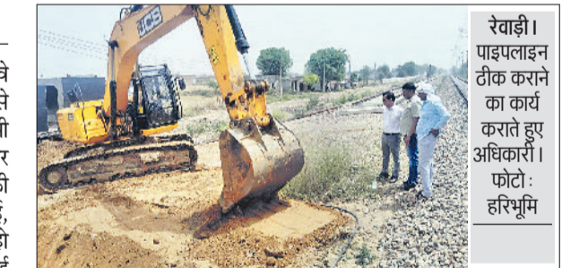
रेवाड़ी। पाइपलाइन ठीक करने का कार्य कराते हुए अधिकारी।