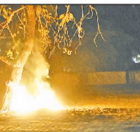
रेवाड़ी। धारुहेड़ा के औद्योगिक क्षेत्र में जला हुआ कचरा तथा शहर के नेहरू पार्क के पास जलता हुआ कचरा।

हूए हरियाणा राज्य प्रदूषण नियंत्रण विभाग ने क्षेत्र में जांच की और दोषी पाए जाने पर हरियाणा शहरी विकास प्राधिकरण के एस्टेट विभाग के खिलाफ 25 हजार रुपये का जुर्माना लगाया गया। सूत्रों के अनुसार यह कार्रवाई नियमों के उल्लंघन को रोकने और अन्य इकाइयों को चेतावनी देने के