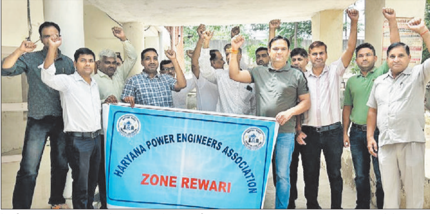
रेवाड़ी। जिला मुख्यालय पर विरोध प्रदर्शन करते पाँवर इंजीनियर्स।