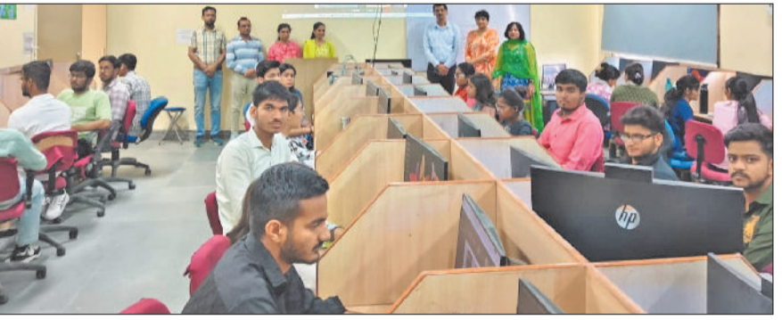
रेवाड़ी। कार्यशाला में मौजूद शिक्षक व विद्यार्थी।