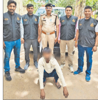
रेवाड़ी। पुलिस गिरफ्तार में आरोपी।