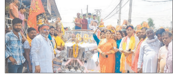
रेवाड़ी। प्राण प्रतिष्ठा से पूर्व विंटेज कार में शोभायात्रा निकालते श्रद्धालु।

शहर की दुर्गा कॉलोनी स्थित शिव मंदिर में मंगलवार श्रद्धा और उत्साह के साथ राम दरबार, मां दुर्गा, राधा-कृष्ण और बजरंगबली महाराज सहित विभिन्न देवी-देवताओं की मूर्तियों की विधिवत रूप से प्राण प्रतिष्ठा की गई। यह आयोजन पूर्व गुरु रखसार के संयोजन में सम्पन्न हुआ। कार्यक्रम से पूर्व सोमवार रात्रि जागरण का आयोजन किया गया। मंगलवार सुबह श्रद्धालुओं ने भव्य कलश यात्रा निकाली। इस दौरान श्रद्धालुओं ने देवी-देवताओं की मूर्तियों को विंटेज कार में भ्रमण कराया। शोभायात्रा के दौरान श्रद्धालुओं ने भजन-कीर्तन और